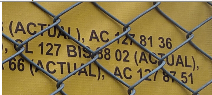
Foto 1.- Nomenclatura del sitio de visita

Radicado - Concepto Técnico o Acto Administrativo: Resolución N° 01877 de 25/07/2019